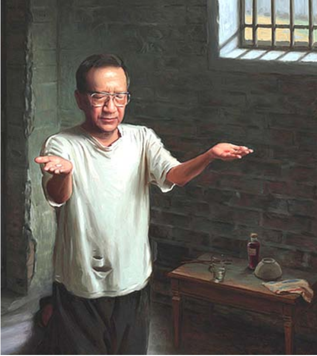
Đức cố Hồng Y Phanxico

“Anh em hãy yêu thương nhau như Thầy đã yêu thương anh em.”