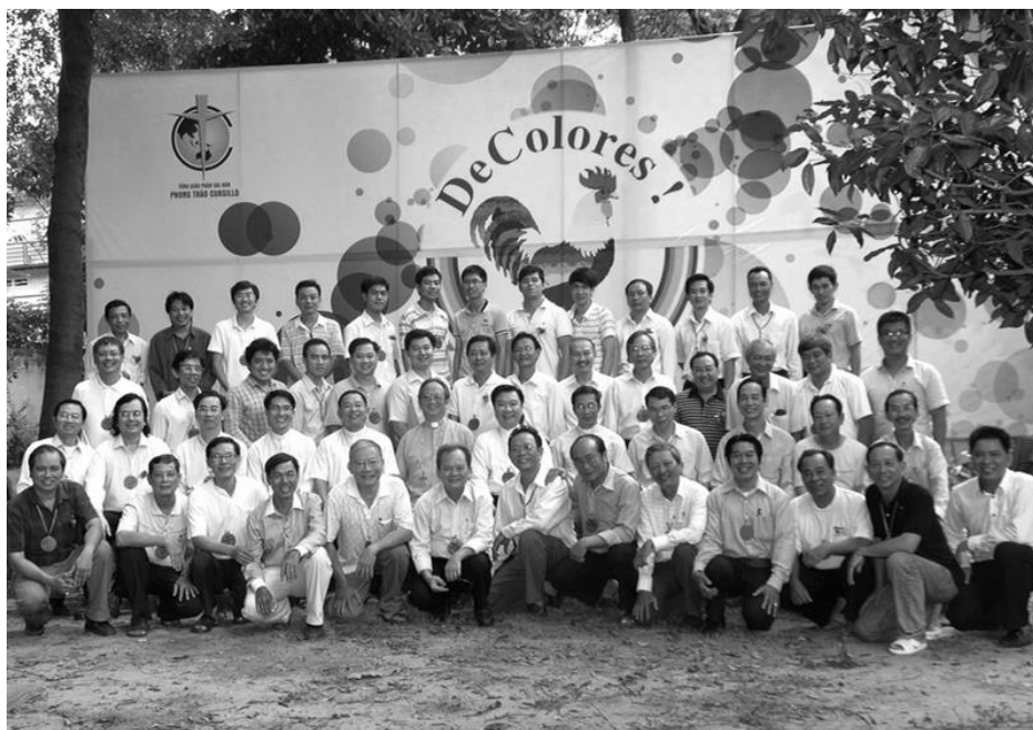
Đức TGM Phaolô đến thăm Khóa #11